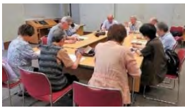
「うたごえ広場」のミーティング