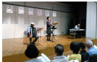
アコーディオンの演奏とボーカルを聴きました